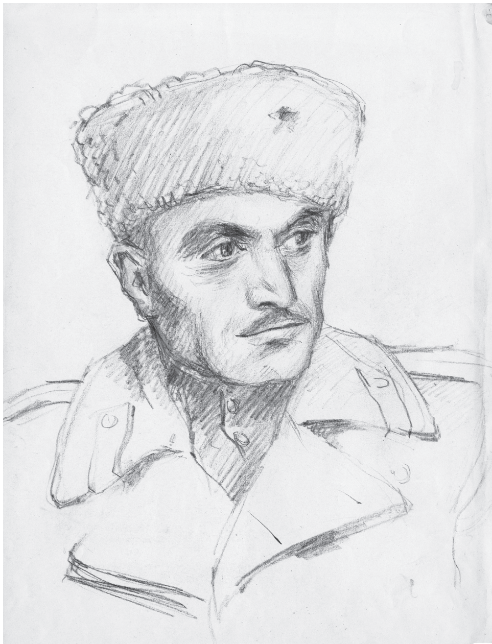
«Портрет военного». 1943.