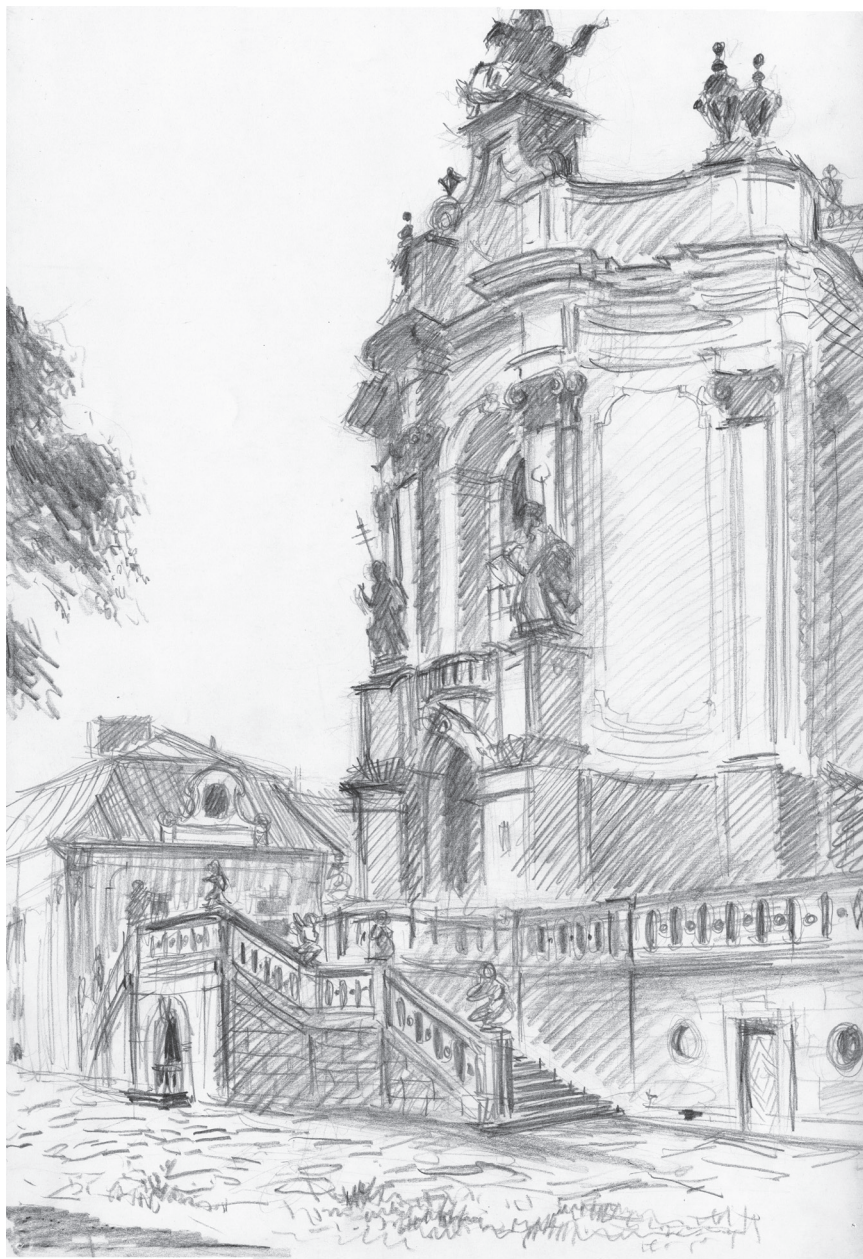
«Старый Львов». 1952.