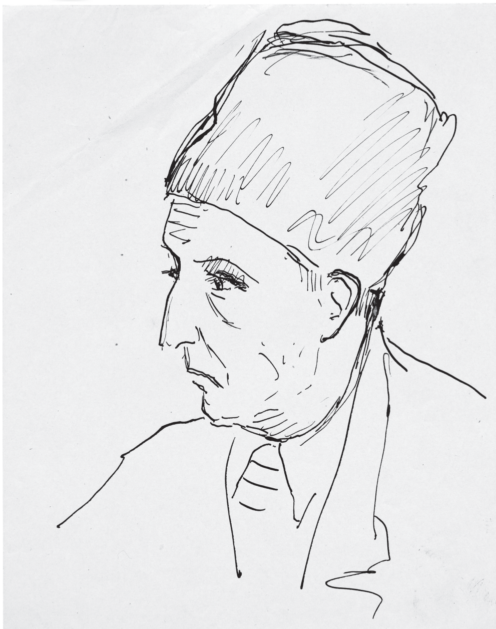
«Мужчина в папаче». 1960-е годы.