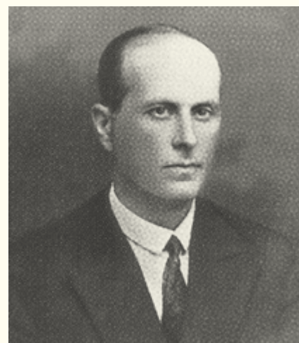
В. В. Крузенштерн (1888–1937)