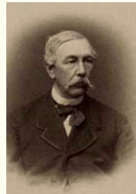
А. Ф. фон Крузенштерн

Алексей Федорович оставил заметный след в истории края. Он был верным соратником и помощником князя Барятинского в его неустанных заботах о процветании и развитии Кавказа. Были приняты «самые энергичные меры к восстановлению порядка и прекращению почти повсеместных разбоев за Кавказом. Обращено внимание на лучшее устройство и содержание городов, в особенности Тифлиса, где, кроме других улучшений, разведен прекрасный Александровский сад на обширном пустыре в центре города... Дана полная свобода в религиозном отношении «молоканам» и «духоборцам».