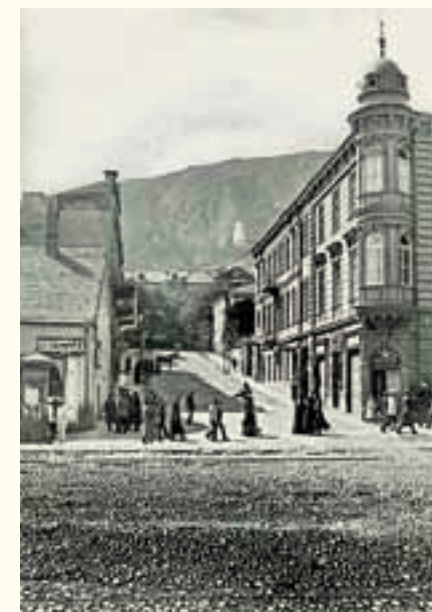
Тифлис (Тбилиси), улица Крузенштерна в начале XX в. и в 2016 г.