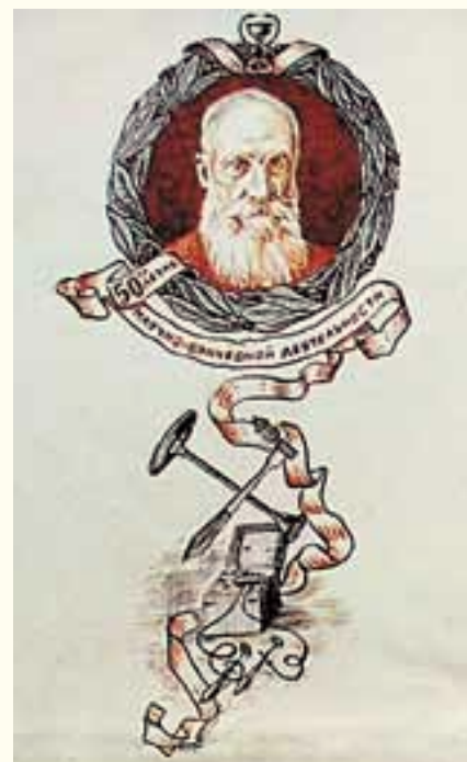
Н. А. Крузенштерн /рисунок на юбилейном адресе 1926 г. Хранится в семье О. В. Кудрявцевой

После Октябрьского переворота Николай присоединился к Белому движению. Последнее звание – капитан 2-го ранга. Был в эмиграции в Германии. Опубликовал несколько статей в «Морском журнале». Умер 7 января 1945 года 34 .