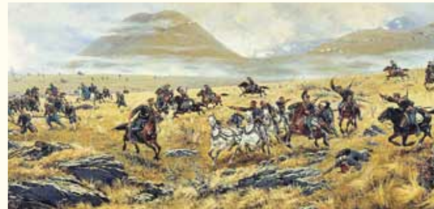
Аладжинское сражение. 3 октября 1877 г. /худ. А. Д. Кившенко