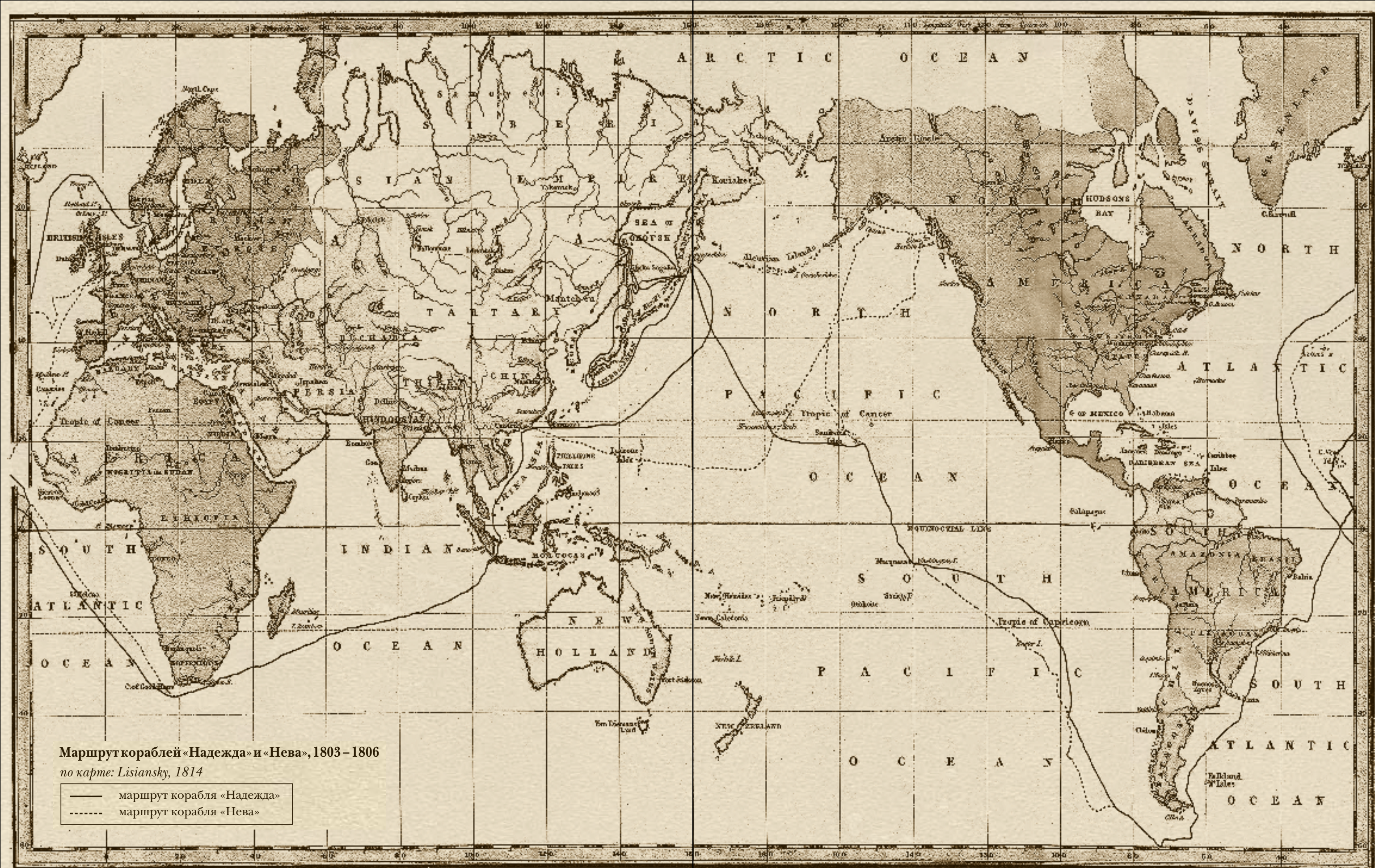
Маршрут кораблей «Надежда» и «Нева», 1803–1806