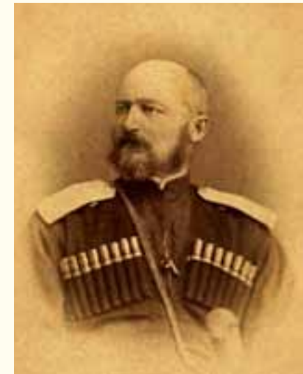
Н. К. фон Крузенштерн