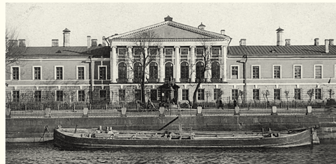
Петербург. Обуховская больница /фото конца XIX в.

13 апреля 1885 года Николай Эдуардович фон Крузенштерн получил звание доктора медицины и с целью поправления материального положения семьи занял место врача на частном золотом прииске на реке Лене, где находился до 1888 года. В 1889–1893 годах вернулся на государственную службу, исполнял обязанности старшего врача больницы Приказа общественного призрения в Ревеле (Таллинн). В 1893–1894 годах – губернский медицинский инспектор в Эстляндии. В 1894 году